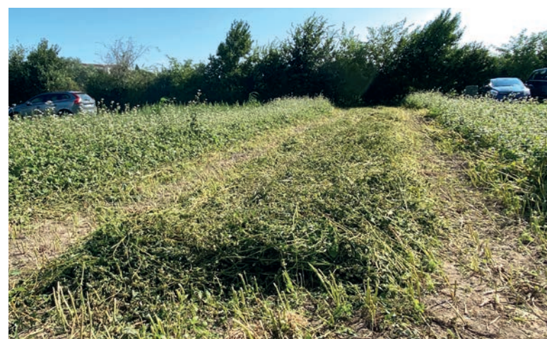
Sarrasin andainé à l'occasion de Tech&Bio. Chantier réalisé grâce à un modèle ancien de faucheuse andaineuse automotrice prêt par un producteur de semences potagères.