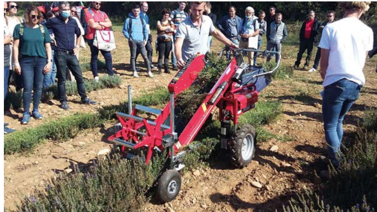
La récolteuse électrique Terrateck permet une vitesse d'avancement jusqu'à 2 km/h.