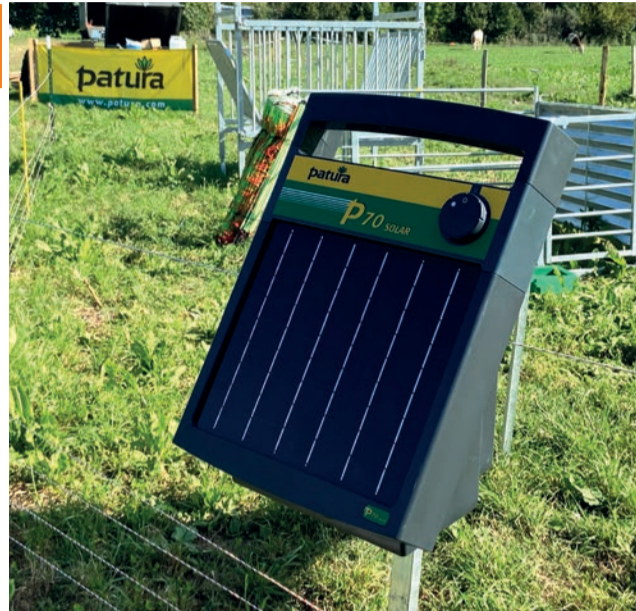
Le P70 Solar de Patura permet d'électrifier jusqu'à 5 km de clôtures.

Il s'installe sur un piquet de terre qui sert également de support. Son poids léger (2,7 kg pour le P25 et le P35, 6 kg pour le P70 et le P140) en font, selon le constructeur, le poste électrique idéal pour les terrains difficiles d'accès ou les déplacements fréquents de clôtures. Ce poste solaire portatif est également capable de réguler les impulsions pour économiser l'énergie sur une période de faible luminosité.