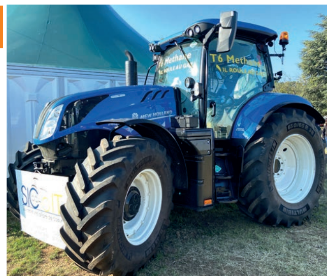
Départ usine, le T6.180 Méthane Power est proposé soit avec un réservoir de 200 l, soit complété par un réservoir à l'avant qui permet de monter à 500 l de GNV.