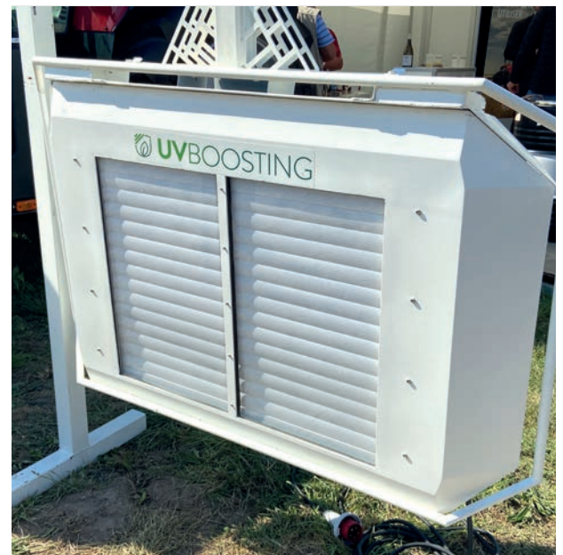
L'UV Boosting peut être monté sur tracteur ou enjambeur. La durée de vie de chaque lampe à UVC est de 5 000 h (annoncée par le constructeur).

La gamme Helios de la société UV Boosting (basée dans les Yvelines) s'appuie sur la découverte de deux chercheurs de l'université d'Avignon : la possibilité de stimuler les défenses naturelles de la plante par des flashes UVC. La plante réagit à ce signal en produisant des composés liés à sa défense contre les pathogènes, comme l'acide salicylique. Cette stimulation permet à la vigne, d'après le constructeur, de déclencher de façon plus rapide et intense ses mécanismes de défense lorsqu'elle est exposée au mildiou, à l'oïdium, au black-rot mais aussi au gel. La stimulation doit être effectuée tous les 10 à 14 jours à partir du stade 2-3 feuilles et jusqu'à la fin de la fermeture de la grappe. L'effet contre le gel n'est garanti que par une stimulation dans les 48 heures à 4 jours précédents l'épisode. Les panneaux à lampes UV peuvent être fixés sur tracteur ou enjambeur. Le coût pour deux rangs complets, soit quatre panneaux, est de 54 000 euros. Les établissements Banc (07 et 26) distribue cet outil.