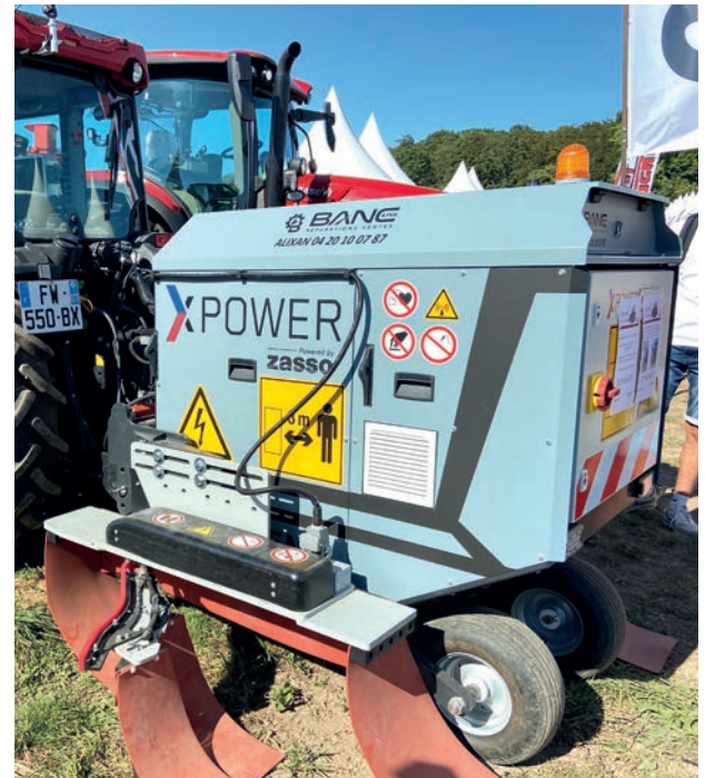
Le Xpower de la société suisse Zasso est distribué en Drôme et Ardèche par les établissements Banc.

Pour voir tourner le désherbeur électrique Xpower pour vignes et vergers, il fallait se rendre sur le stand des Ets Banc sur le pôle grandes cultures du Tech&Bio. Le XPower assure une destruction électrophysique des mauvaises herbes et plantes envahissantes grâce à un circuit électrique fermé, uniforme et ciblé. Le modèle XPS est disponible en version frontale ou arrière et propose, selon la configuration, une largeur de travail de 1,52 à 4,85 mètres. Le constructeur annonce une vitesse de travail jusqu'à 4 km/h. A la suite d'essais menés l'année dernière, l'Institut Français de la Vigne et du Vin (IFV) indique : « L'efficacité du désherbage électrique est très satisfaisante : plus de 80 % de destruction dans des conditions de travail optimales. Le nombre des interventions par an semble dépendre des conditions météorologiques, ce qui est une caractéristique de toutes les alternatives aux herbicides. Un contrôle efficace des mauvaises herbes a été atteint avec trois interventions durant la saison 2020. » Le modèle Xpower présenté au Tech&Bio est annoncé à partir de 110 000 euros HT.