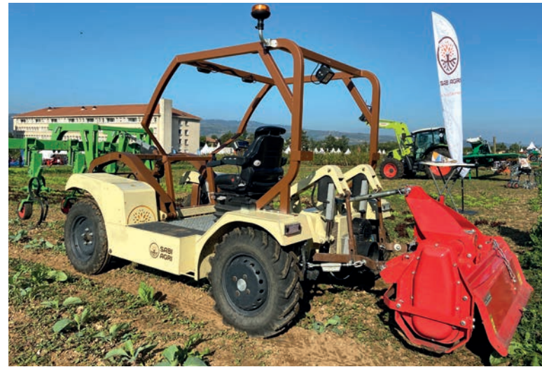
Le POM de Sabi Agri permet de préparer les sols, planter et entretenir les cultures, récolter, réaliser de la manutention...