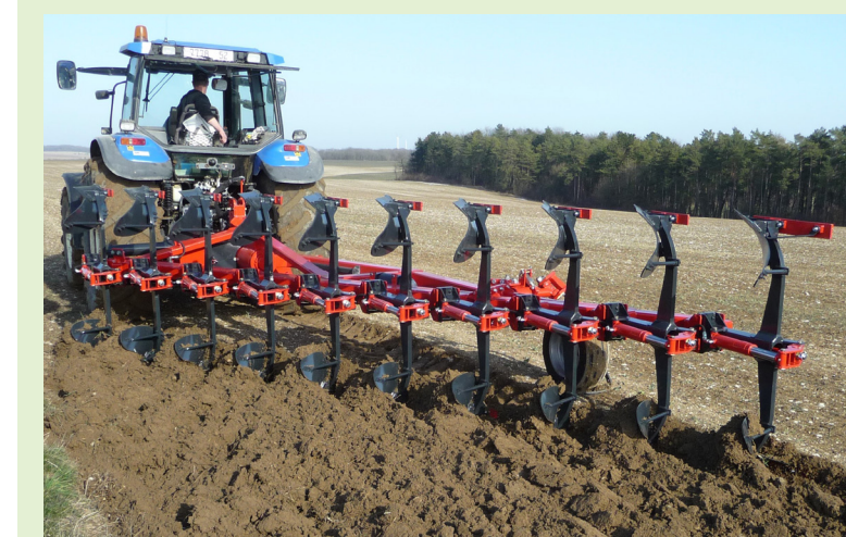
Les charrues déchaumeuses travaillent généralement entre 12 et 17 cm de profondeur.

La principale difficulté du labour à faible profondeur est de bien retourner la bande de terre, afin d'enfouir correctement les résidus végétaux. Pour y parvenir, la charrue Bugnot Rapid Lab, conçue pour travailler au maximum à 23 cm, dispose de socs ne tranchant que deux tiers du fond de raie, laissant ainsi une partie non découpée qui sert de charnière. Celle-ci est ensuite soumise à l'action d'une lame arrière qui coupe le tiers restant. Le bon enfouissement des débris est assuré par une rasette ou par le déflecteur monté au-dessus du versoir. Le constructeur haut-marnais propose par ailleurs deux types de corps de 13 pouces de large se différenciant par leur angle d'attaque. Le premier, de 37 degrés, est préconisé pour les sols limoneux et très argileux. Le second, de 45 degrés, est conseillé pour les terres légères et argilo-calcaires. ■