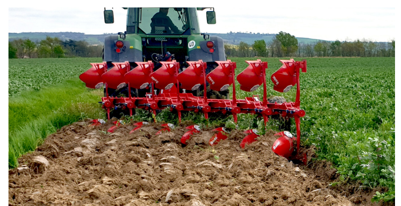
Les charrues déchaumeuses sont particulièrement plébiscitées pour le labour superficiel.

Elles imposent également d'être rigoureux en termes de gestion du tapis végétal. L'idéal est de broyer les résidus végétaux avant de labourer. Plus les débris végétaux sont hachés et réduits, plus leur décomposition est accélérée. En revanche, le déchaumage préalable est déconseillé si