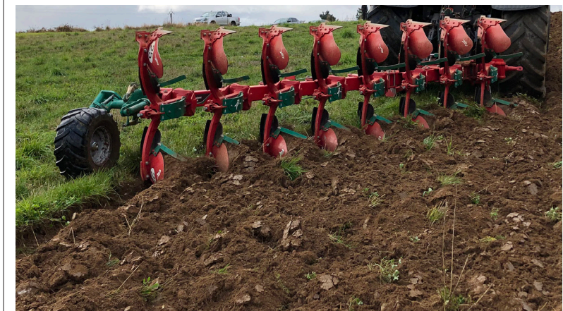
Selon les marques, les charrues déchaumeuses s'utilisent en raie ou hors raie.