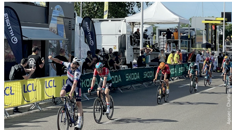
Victoire de Kasper Asgreen pour l'arrivée de la 18 e étape du Tour de France à Bourg-en-Bresse, le 20 juillet 2023.

l'entreprise organisatrice du Tour de France). Puis le jour J, depuis deux heures du matin, près de 70 employés municipaux s'emploient à fermer les rues, à retoucher les routes. On commence à avoir l'habitude, mais ça reste un travail titanesque », assure-t-il. « Plus de 1 000 barrières ont été posées sur environ deux kilomètres linéaires : c'est le résultat du travail de plus de 100 employés municipaux », complète-t-il. Côté budget, l'enveloppe est partagée entre Grand Bourg Agglomération et la Ville de Bourg-en-Bresse : au total, cela représente un investissement de 330 000 €. Les retombées économiques attendues, elles, sont estimées entre 3 et 4 € pour 1 € dépensé. Une bonne nouvelle pour les hôtels, qui eux, ont affiché complet du mercredi au vendredi, avec plus de 2 000 nuitées réservées. « C'est un évènement phare pour l'économie locale, la restauration, l'hôtellerie et les commerces », assure