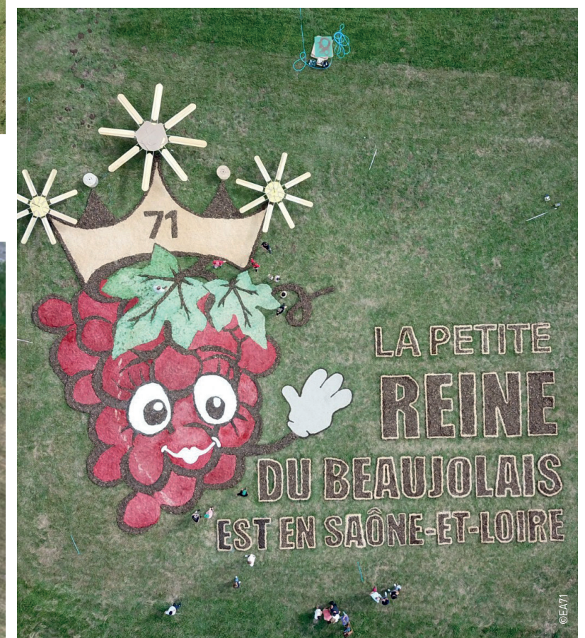
Lors de la 12 e étape du Tour de France 2023, entre Roanne et Belleville-en-Beaujolais, la caravane et les cyclistes sont passés en Saône-et-Loire, sur 1 800 mètres précisément, à la Chapelle-de-Guinchay. Un comité d'accueil des plus sympathiques les attendait avec de forts cris d'encouragement. Et surtout, filmé depuis le ciel, la fresque réalisée est passée devant des millions de téléspectateurs qui ont pu lire : la petite reine du Beaujolais est en Saône-et-Loire.