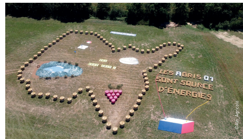
La fresque des agriculteurs de l'Ain et ses productions emblématiques : poulet de Bresse, poissons de Dombes, fromages et vins du Bugey.

Le Tour de France, c'est aussi un rendez-vous d'envergure au cœur de nombreux terroirs. Et le département de l'Ain regorge de produits qui font la fierté des agriculteurs. « On a tout intérêt à faire connaître nos produits au grand public : parler de notre métier, de nos pratiques, c'est une chance sur un évènement comme