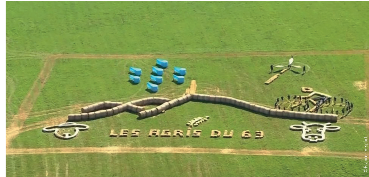
La fresque réalisée par les agriculteurs de la FNSEA63 et JA63 à Ballot sur la commune de La Goutelle, était une représentation générale de l'agriculture et du territoire du Puy-de-Dôme. Les éléments principaux représentés sont le relief du Puy-de-Dôme et du Puy de Pariou son voisin. L'eau, source de vie pour tous, et pour l'agriculture, est représentée par un nuage et des gouttes de pluie avec de l'enrubannage bleu. On retrouve la diversité des productions du département au travers d'une vache, d'un épi de blé et d'un mouton. Les énergies collectives sont représentées par une éolienne.