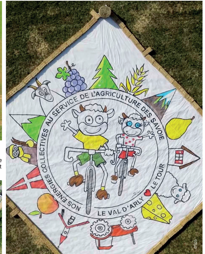
Sur l'étape n°17 du 19 juillet, à Flumet en Savoie, la FDSEA des Savoie a mis en place avec ses partenaires une fresque de 600 m 2 , axée sur les énergies collectives au service de l'agriculture. Un stand sur l'emploi et les formations agricoles, ainsi qu'une buvette et un food truck avec les viandes et fromages de la vallée étaient également proposés aux visiteurs.