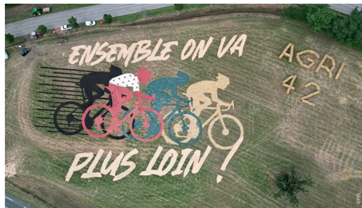
Le 13 juillet dans la Loire, la FDSEA, appuyée par Jeunes agriculteurs et différents partenaires, ont réalisé une fresque de 10 000 m 2 sur la commune de Montagny. Diffusée en direct à la télévision au moment du passage des coureurs, cette fresque a été l'occasion de souligner le travail mené chaque jour par les agriculteurs pour nourrir la population.