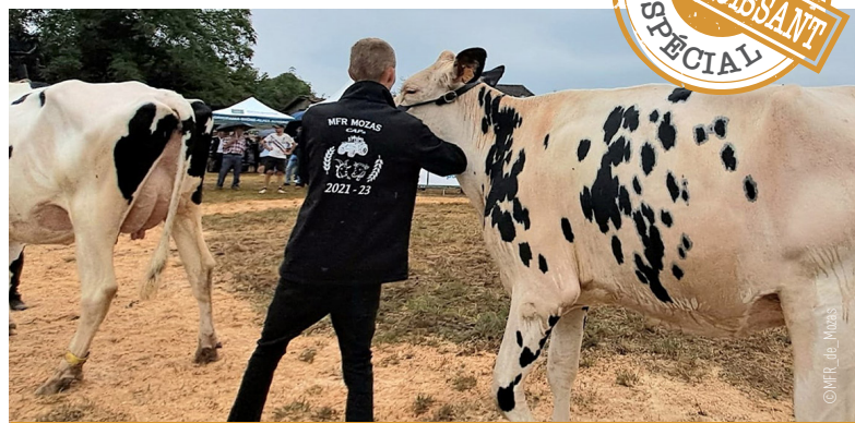
Les étudiants en terminale de bac professionnel CGEA aideront les éleveurs qui participent au concours du syndicat Charolais Sud-Est à soigner les animaux pendant la Foire de Beaucroissant.

BERNARD MATERIELS AGRICOLES 01 Châtillon-s/Chalaronne T. 04 74 32 89 20 01 Dagneux T. 04 78 06 15 26 39 Saint-Maurice-l'Exil T. 04 74 86 27 40 01 Chevroux T. 03 85 51 82 84 VALAGRI 01 Honnettes T. 04 79 87 72 50