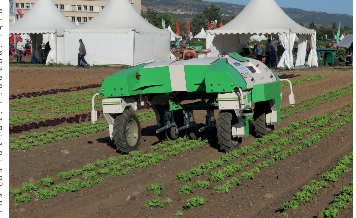
Selon le récent rapport SolRob, 90 % des arboriculteurs et 60 % des maraîchers sont en attente d'une solution pour la récolte, 75 % pour des solutions de désherbage. Mais l'investissement à consentir par les producteurs est un sérieux frein.

(un robot mono tâche peut coûter plus de 100 000 euros) est un sérieux frein - notamment pour les outils de récolte. « Il faut rester pratique-pratique et réfléchir en termes d'investissement collectif, explique Olivier Sinquin, directeur de la Sica Saint Pol de Léon. Nous travaillons sur la pénibilité de certaines tâches primaires - le binage, le sarclage - et dans cette optique, la mécanisation a un intérêt. » Même prudence chez Laurent Paillat, président de l'Anefa, qui est aussi maraîcher dans le Gard : « La robotisation peut valoir le coup sur l'assistance des travailleurs : plantation électrique, broeuse assistée... Ne consacrer que 20 % de la main-d'œuvre à la mise en culture grâce à la mécanisation et 80 % pour la récolte peut s'avérer un choix intéressant pour l'exploitation. » Entre autres bénéfices pour l'agriculture, le CGAAER souligne que la mécanisation exercerait une influence positive sur les perspectives d'évolution ou d'insertion durable pour les salariés saisonniers : « Au travers d'un CQP (formation courte durée, ndlr), les salariés saisonniers pourront se voir reconnaître une qualification permettant une meilleure reconnaissance, une progression salariale et une embauche en CDI ». ■