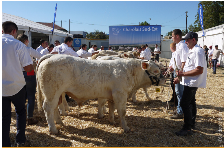
135 animaux défilèrent sur le ring de la Foire de Beaucroissant cette année.